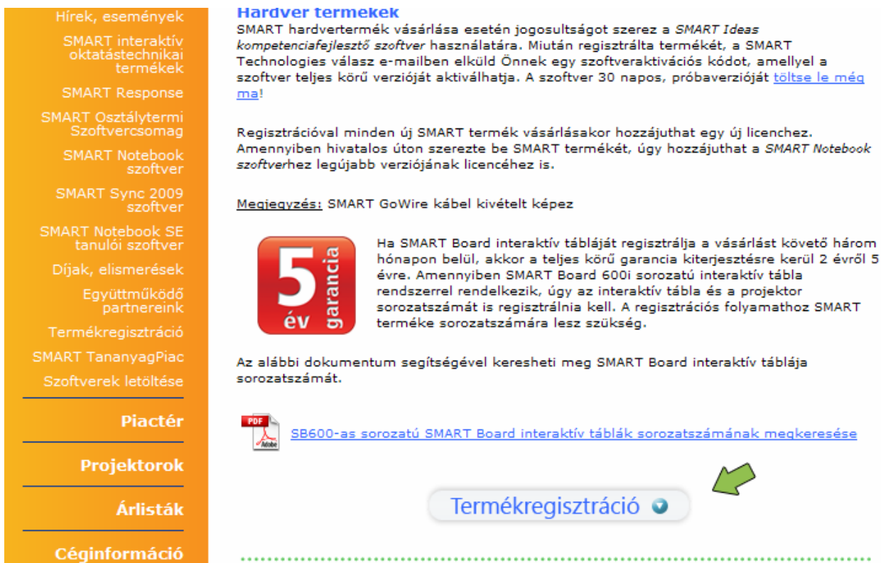
1. ábra. Az LSK Hungária Kft. termékregisztrációs weboldala